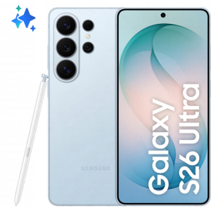
Galaxy S26 Ultra Galaxy AI

Nome del prodotto : Galaxy S26 Ultra Smartphone AI, 1TB, Privacy Display integrato, Processore potente, Assistente Foto, Camera 200 MP, 5000 mAh, Sky Blue